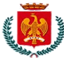
Comune di Palermo